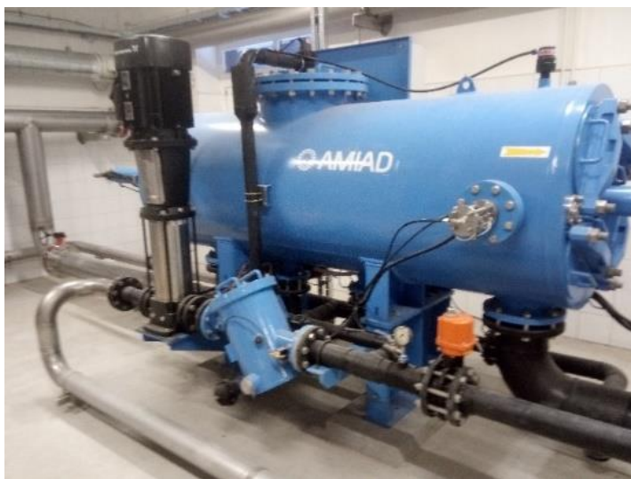
Automatický samočistiaci mikrovlnkový filter

Cieľom rekonštrukcie bolo zvýšiť kapacitu úpravne vody, zlepšiť úpravu pri zvýšenom vstupnom zákalu vody a znížiť potrebu ľudských zásahov do procesu úpravy vody. Projektovaná produkcia úpravne je 30 l/s upravenej vody. Úprava surovej vody prebieha do zákalu 50 NTU. S rastúcim zákalom surovej vody je produkcia postupne znižovaná až na 10 l/s a pri dosiahnutí 50 NTU je produkcia automaticky pozastavená. Po opätovnom poklese zákalu je úprava vody automaticky spustená. Kvalita surovej vody spĺňa požiadavky na pitnú vodu bez nutnosti riešiť odstraňovanie kovov. Upravená voda na výstupe z ÚV dosahuje štandardne výstupný zákal do 0,05 NTU.